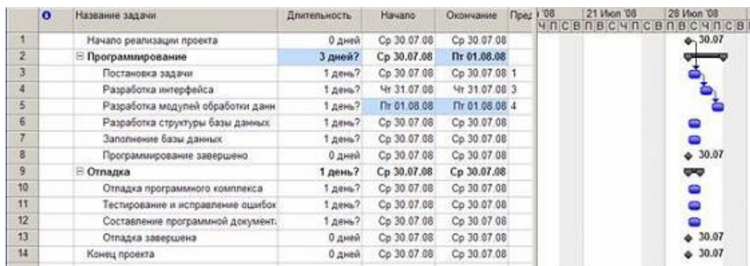
Рис.Создание связи через столбец Предшественники