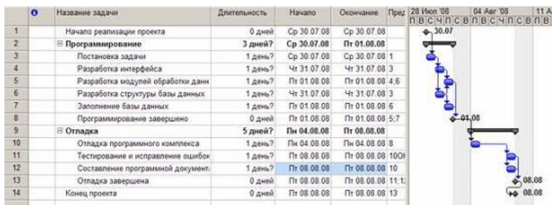
Рис. Результат преобразований